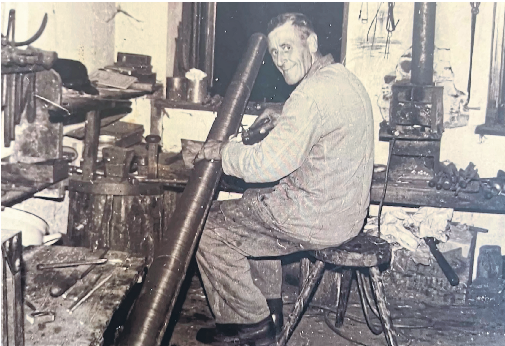
Zeitreise: Ein Blick in die Werkstatt früherer Jahre.